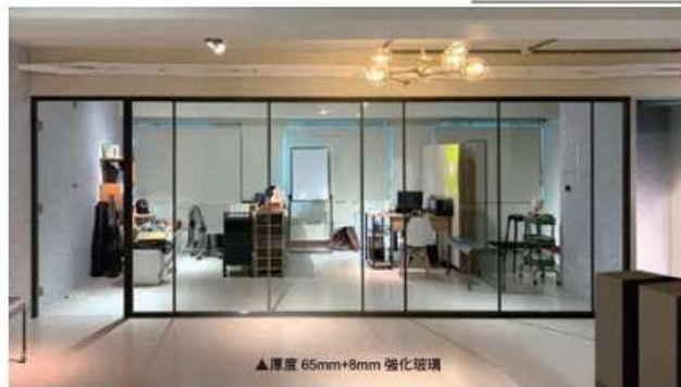
▲厚度 65mm+8mm 強化玻璃

單層玻璃隔間，厚度 65mm 搭配 8mm 強化玻璃，充分展現視覺延伸效果，採組合式安裝施工，材料皆可重複使用，具備完美的電線管理及走線功能。