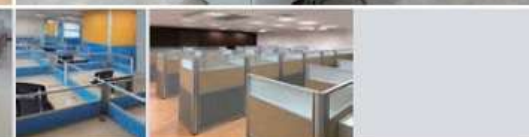
2.5cm 屏風系列，薄片屏風、不佔空間，新穎輕巧、美不勝收。