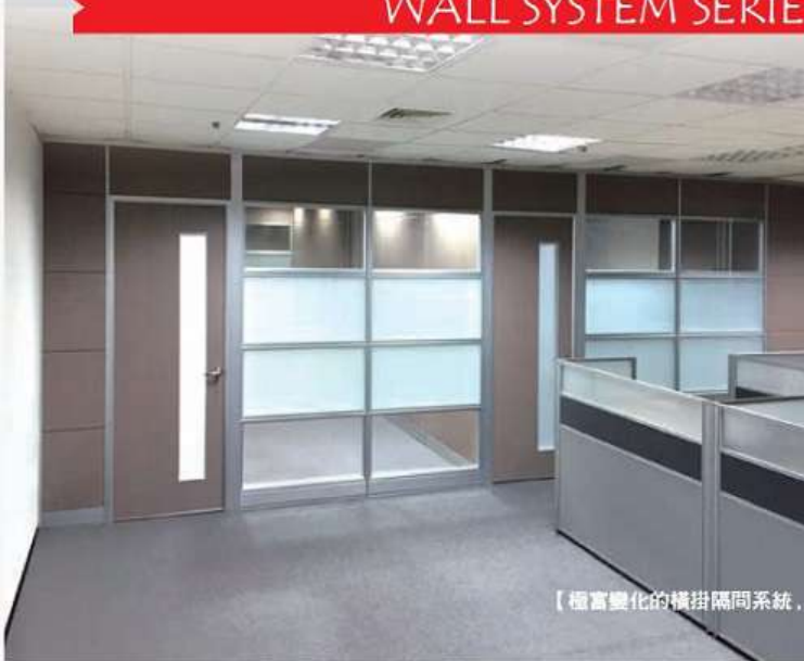
【極富變化的橫掛隔間系統，讓空間更具張力及變化性。】