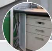
▲走線槽，線路完全隱藏不外露。