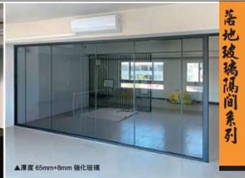
▲厚度 65mm+8mm 強化玻璃